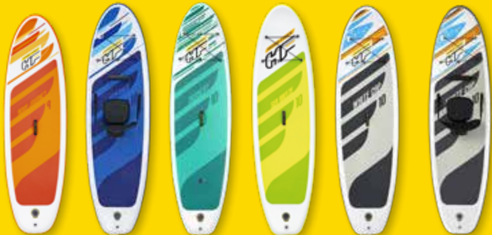
Aqua Journey Oceana Huaka'i Tech Sea Breeze White Cap White Cap Convertible