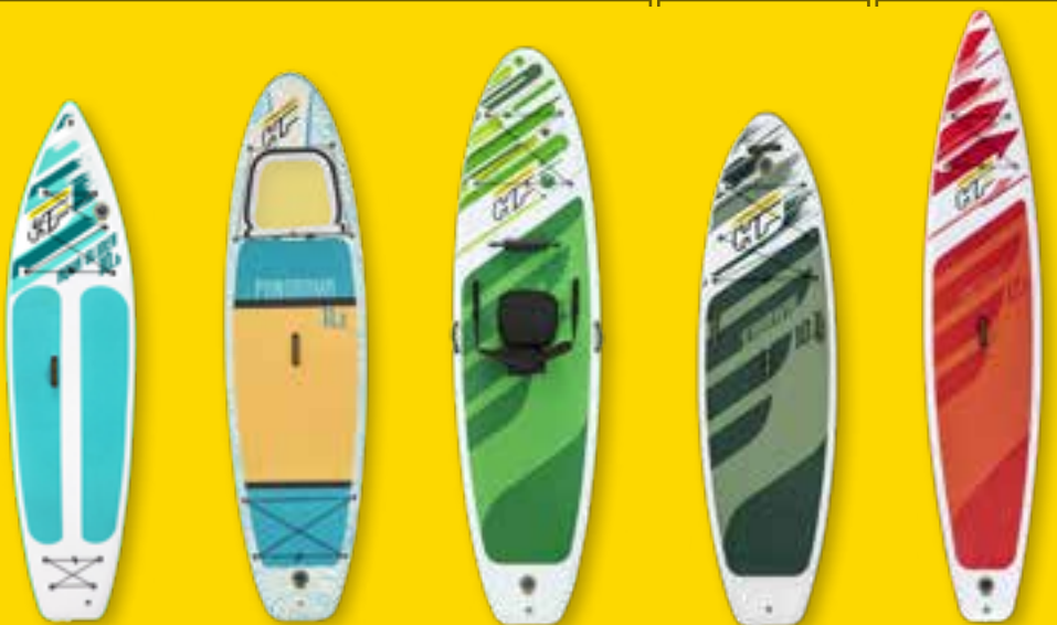
Aqua Glider Panorama Free Soul Tech Kahawai Fast Blast Tech